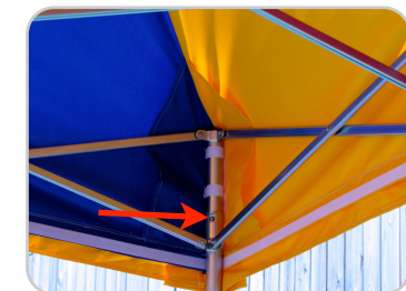
Bild 10: Die Ecken hochschieben und einrasten las- sen Beim zusammenbauen erst die Füße kom- plett einschieben dann die Ecken lösen