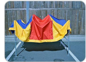
Bild 5: Dachplane auf das Gestell ausbreiten und an den Ecken befesti- gen